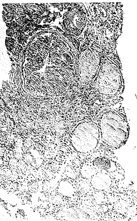
آمیلاز کلیه همراه با پیلو نفریت مزمن

یکصد و بیست و نه مورد بیمار مبتلا به سندروم نفروزی مسورد بحث این مقاله همه در بخش طبی یک بیمارستان پهلوی بستری و تحت مطالعه و درمان بوده‌اند. در جدولهای موجود خصوصیات آنها از نظر جنس و سن، مدت بیماری، علائم بالینی و آزمایشگاهی و بافت‌شناسی بطور مجمل منعکس شده است. از نظر جنس باید یاد آور شد که ۷۳ مورد مرد و ۵۴ مورد زن بوده‌اند. از نظر سن در دو سوم موارد سن بیماران کمتر از ۲۵ سالست.