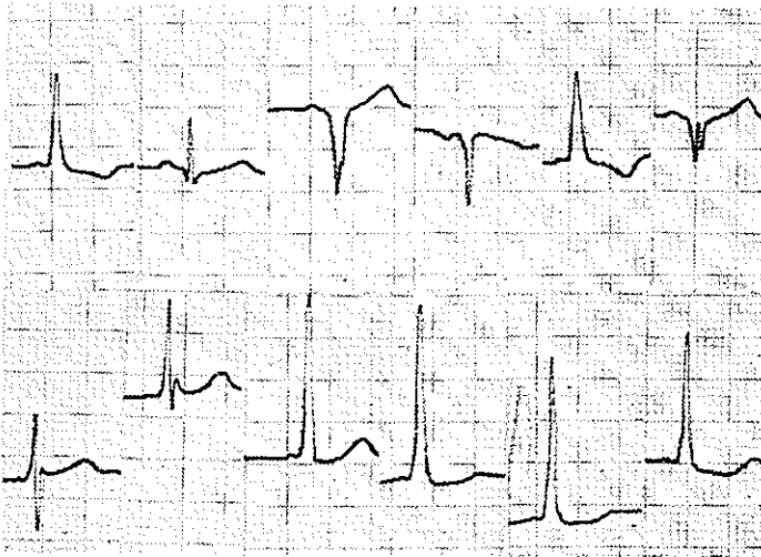
شکل ۲ - WPW از نوع A

از روی جهت و کتور موج دلتا سندرم WPW بدو نوع تقسیم میشود نوع A و B در نوع A جهت و کتور موج دلتا قدامی و بر است است و ایجاد R بلند در V1 و V2 مینماید (شکل ۲) در نوع B موج دلتا متوجه چپ بوده و در V1 و V2 امواج QS ایجاد مینماید.