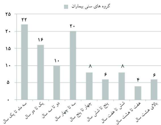
نمودار ۱: فراوانی گروه‌های سنی بیماران مبتلا به چسبندگی لایا

گردیدند. در نهایت ۱۰۰ بیمار در آنالیز نهایی شرکت داده شدند. بیشترین فراوانی سنی در کودکان زیر یکسال و کمترین فراوانی در کودکان ۷-۸ سال وجود داشت (نمودار ۱). بیشترین فراوانی شدت چسبندگی قبل از درمان مربوط به چسبندگی درجه دوم (۴۴ مورد از ۱۰۰ مورد) و پس از درمان مربوط به چسبندگی درجه اول (۴۸ مورد از ۱۰۰ مورد) بود (نمودار ۲). در مجموع ۸۶٪ بیماران به درمان پاسخ داده بودند و تنها ۱۴٪ هیچ‌گونه بهبودی نداشتند. در هیچ‌کدام از بیماران شدت چسبندگی بدتر نگردیده بود. قبل از درمان ۱۴ کودک دارای عفونت ادراری و ۲۲ نفر دارای سایر علایم از جمله هماچوری