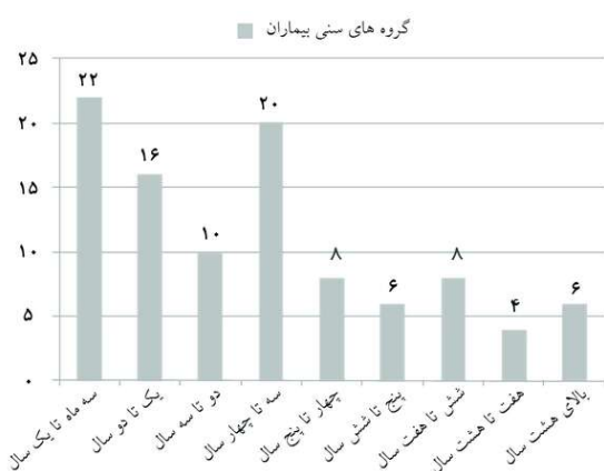
نمودار ۱: فراوانی گروه‌های سنی بیماران مبتلا به چسبندگی لایا

از تمام والدین کودکان رضایت‌نامه کتبی اخذ گردید. اطلاعات بیماران محرمانه بوده و فقط برای انجام آنالیز آماری استفاده گردید. در صورت بروز هر گونه عارضه‌ای بیمار از مطالعه خارج شده و اقدامات لازم در جهت قطع مصرف دارو و درمان عوارض ایجاد شده انجام گردید. تمام هزینه‌های درمان، پی‌گیری و عوارض بیمار رایگان بوده و هیچ هزینه‌ای به بیماران تحمیل نگردید. پس از کسب اجازه از کمیته اخلاق دانشگاه علوم پزشکی گرگان، پیش‌نویس مطالعه در بانک اطلاعاتی کارآزمایی بالینی ایران با شماره IRCT2012121611560N1 ثبت گردید. داده‌های به‌دست آمده از بیماران با استفاده از نرم‌افزار آماری SPSS ویراست ۱۹ مورد آنالیز قرار گرفت. شدت چسبندگی قبل و پس از درمان به‌دست آمد. بر حسب بهبود چسبندگی و پاسخ‌دهی به درمان بیماران به دو گروه تقسیم شده و اختلاف میانگین سطح سرمی استرادیول در دو گروه با آزمون آماری Student's t-test مورد بررسی قرار گرفت. قدرت آماری مطالعه معادل ۸۰٪ با خطای ۵٪ برآورد گردید. مقدار P < 0/05 معنی‌دار در نظر گرفته شد.