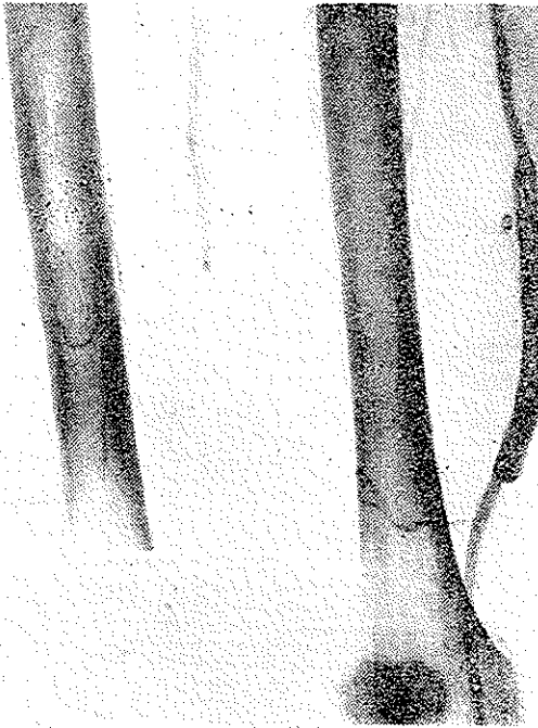
شکل ۲ - آرتریوگرافی بعد از عمل پیوندروی سرخرگ رانی

فemorال در تمام طولش باز شد و آندارتر تشریح و برداشته شد. با قرار دادن ورید صافن داخلی بشکل ناودانی بر روی سرخرگ و دوختن لبه‌های این عروق بیکدیگر مجرای فراخی برای عبور جریان خون در سرخرگ رانی سطحی فراهم گردید (رادیو-گرافی شماره ۲ آرتریوگرافی بعد از عمل بامتد Thromboendarterectomy with vein patch graft را نشان میدهد).