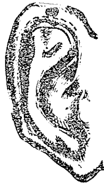
سیستم برش با روش زیرمن