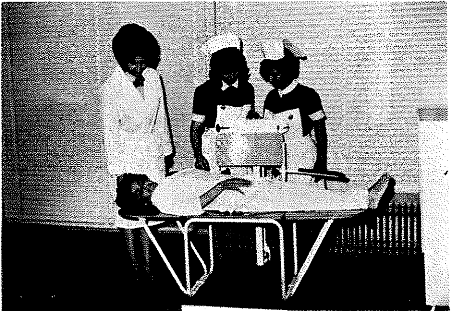
برای تنظیم تعداد آب و الکترولیت‌ها بدن بیمار همیشه