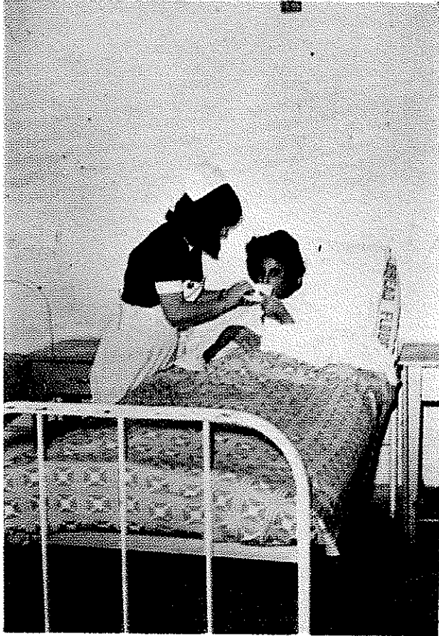
بهبود بیمار هر روز بعد از همودیالیز دوم