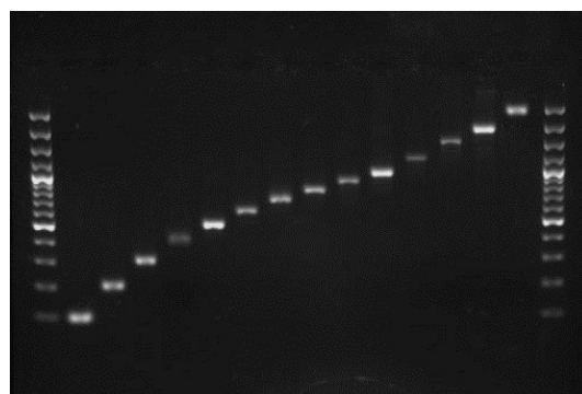
شکل - ۲: الکتروفورز باندهای مربوط به قطعات Ladder تولید شده، از ۱۰۰ تا ۳۰۰۰ جفت باز در مجاورت Ladder ۱۰۰ جفت بازی (شرکت Fermentas SM#0321) روی ژل آگارز.