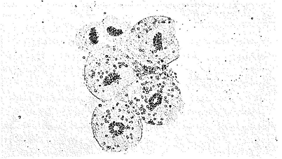
شکل ۱- اسکولکس سالم و دست نخورده