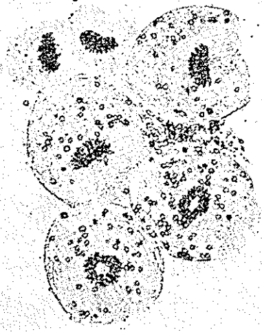
شکل ۱- اسکولکس سالم و دست نخورده