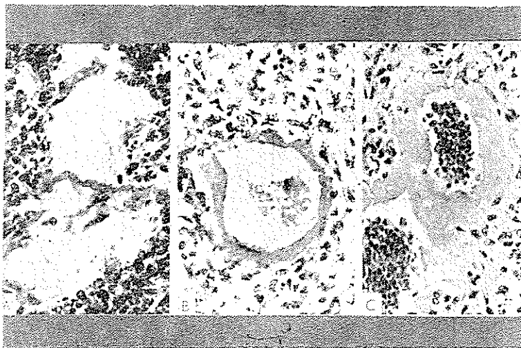
شکل ۱- A - ضخامت پرده هیالین مامبران در این قسمت در حدود ۵۰۰ مو (درجه ۱) و خیز داخل آلوتولی درجه ۲ را نشان میدهد. بچه پرماتوره بوزن ۱۴۸۰ گرم - سرگ پس از ۴ ساعت B - ضخامت پرده هیالین درین قسمت بین ۱۰۰-۱۵۰ مو (درجه ۲) و خیز داخل آلوتولی درجه ۲ میباشد. پرماتوره بوزن ۱۳۱۰ گرم - سرگ پس از ۳۶ ساعت. C - ضخامت پرده هیالین درین ناحیه بین ۲۰-۳۰ مو خیز داخل آلوتولی درجه ۳ است. بچه فول ترم بوزن ۲۶۱۰ گرم - سرگ در روز چهارم تولد.