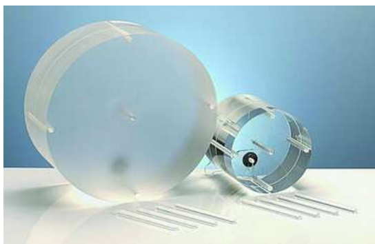
شکل ۱: فانتوم های سر و تنه

در این رابطه CTDI c دوز به دست آمده در مرکز و CTDI p دوز به دست آمده در حفره های محیطی فانتوم های سر و تنه می باشد. فانتوم های سر و تنه دو عدد استوانه از جنس Polymethylmethacrylate (PMMA) با قطر ۱۶ و ۳۲ و طول ۱۵ سانتی متر می باشند. بر روی این استوانه ها یک حفره در مرکز و چهار حفره دیگر نیز در کناره محیطی