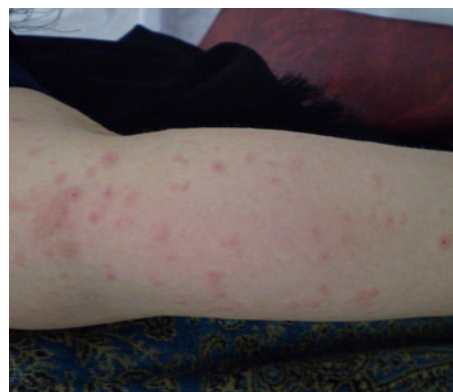
شکل - ۲: ضایعات اندام‌ها

برای بیمار درمان با کلوتنازول موضعی به میزان ۱/۵ لوله ۳۰ گرمی روزانه برای هفت روز و سپس کاهش تدریجی میزان دارو به صورت هفتگی شروع شد. همچنین برای کاهش علائم خارش و تحریک بیمار از کلرفنیرامین خوراکی به میزان ۱۲ میلی‌گرم روزانه در سه دوز منقسم استفاده شد. ضایعات بعد از یک هفته ناپدید شده و خارش بیمار به کلی از میان رفت. در پی‌گیری‌های بعدی سه و شش ماه بعد از زایمان مادر و نوزاد هر دو کاملاً سالم و بدون هیچ گونه عارضه پوستی ارزیابی شدند.