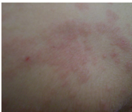
شکل - ۳: نمای نزدیک ضایعات