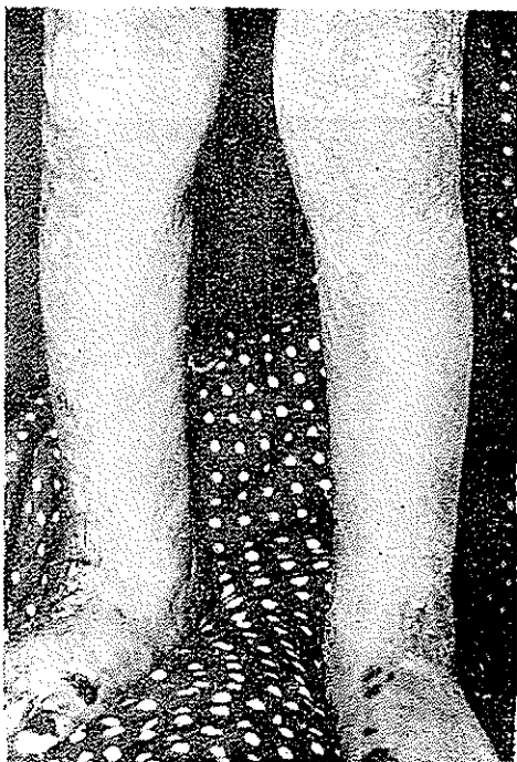
شکل ۳ ضایعات طاوولی و التیام در اندام پائین

دختر بچه ۵ ساله متولد پاریس ساکن تهران . پدر و مادر بیمار نسبت خانوادگی ندارند . در بین افراد خانواده کسی باین بیماری مبتلا نبوده است . بیماری مدت کمی پس از تولد ظاهر شده و نخست طاول از پا و قوزکها پیدا