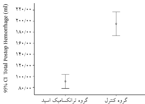
نمودار-۱: مقایسه میانگین خونریزی کلی پس از عمل بین دو گروه ترانکسامیک اسید و شاهد در لامینکتومی یک طرفه و یک سطح ( p<۰/۰۰۵ )

قرار گرفتند بین میانگین سن، فراوانی دو جنس و BMI اختلاف معنی داری در دو گروه دیده نشد. اما بین دو گروه ترانکسامیک اسید و شاهد خونریزی در ۲۴ ساعت اول (به ترتیب ۵۵/۸±۱۰/۰۷ در برابر ۳۵±۳۲/۴۷ میلی لیتر، p=۰/۰۰۱ ) و در ۲۴ ساعت دوم (۹۰/۸±۳۰/۸۸ در برابر ۱۱۶/۴±۳۴/۰۵ میلی لیتر، p=۰/۰۰۱ ) و در کل (۲۱۲/۸±۲۰/۰۶ در برابر ۲۰۵/۸±۱۷/۶۶ میلی لیتر، p=۰/۰۰۱ ) به میزان معنی داری در گروه ترانکسامیک اسید کمتر بود. همچنین در گروه لامینکتومی دوطرفه در دو سطح نیز ضمن این که سن بیماران اختلاف معنی داری نشان داد، اما فراوانی دو جنس و شاخص توده بدن BMI اختلاف معنی داری بین دو گروه نشان ندادند. همچنین خونریزی در ۲۴ ساعت اول (به ترتیب ۹۷/۴±۱۳/۳۹ در برابر ۱۷۹/۶±۲۱/۷۹ میلی لیتر، p=۰/۰۰۱ ) و در ۲۴ ساعت دوم (۱۱۵/۴±۱۲/۴۹ در برابر ۲۱۲/۸±۲۰/۰۶ میلی لیتر، p=۰/۰۰۱ ) و خونریزی کلی (۲۱۲/۸±۲۰/۰۶ در برابر ۳۸۵/۴±۳۷/۸ میلی لیتر؛ p=۰/۰۰۱ ) نیز به میزان معنی داری در گروه ترانکسامیک اسید نسبت به گروه شاهد کمتر بود، ضمن این که مدت بستری نیز در گروه ترانکسامیک کوتاه تر بود (۲/۱۶±۰/۳۷ در برابر ۲/۹۶±۰/۸۹ روز، p=۰/۰۰۱ ). هیچ بیماری از مطالعه خارج نشد و بر اساس نتایج به دست آمده، خونریزی در ۲۴ ساعت اول و دوم پس از عمل و خونریزی کلی پس از عمل در هر دو گروه لامینکتومی یک طرفه یک سطح (نمودار ۱) و دوطرفه در دو سطح (نمودار ۲) در گروه ترانکسامیک اسید به میزان معنی داری از گروه شاهد کمتر بود. همچنین طول مدت بستری نیز در گروه لامینکتومی دوطرفه در دو سطح کوتاه تر بود. موردی از تریق خون و عوارض جانبی نداشتیم.