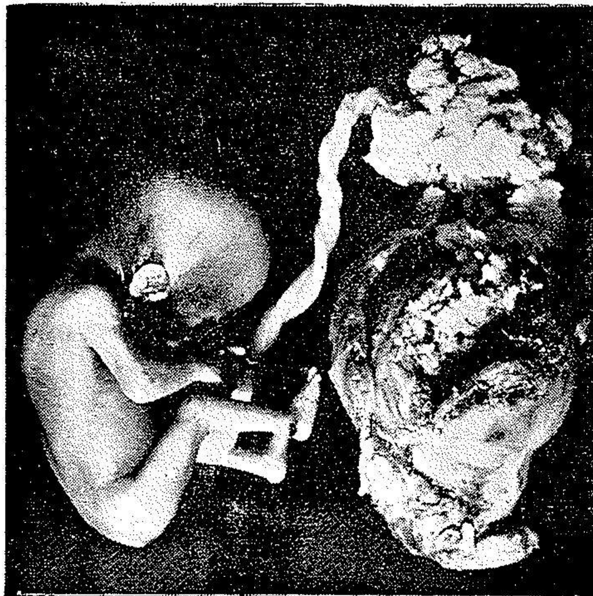
جنین چهارماهه در شاخ فرعی زهدان دو شاخ که منجر به پاره شدن زهدان فرعی شده است