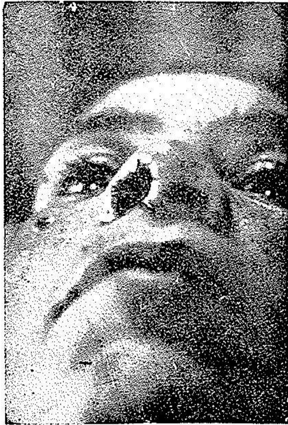
همان بیمار پس از عمل