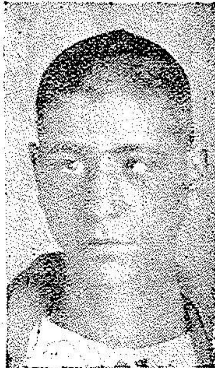
قبل از عمل