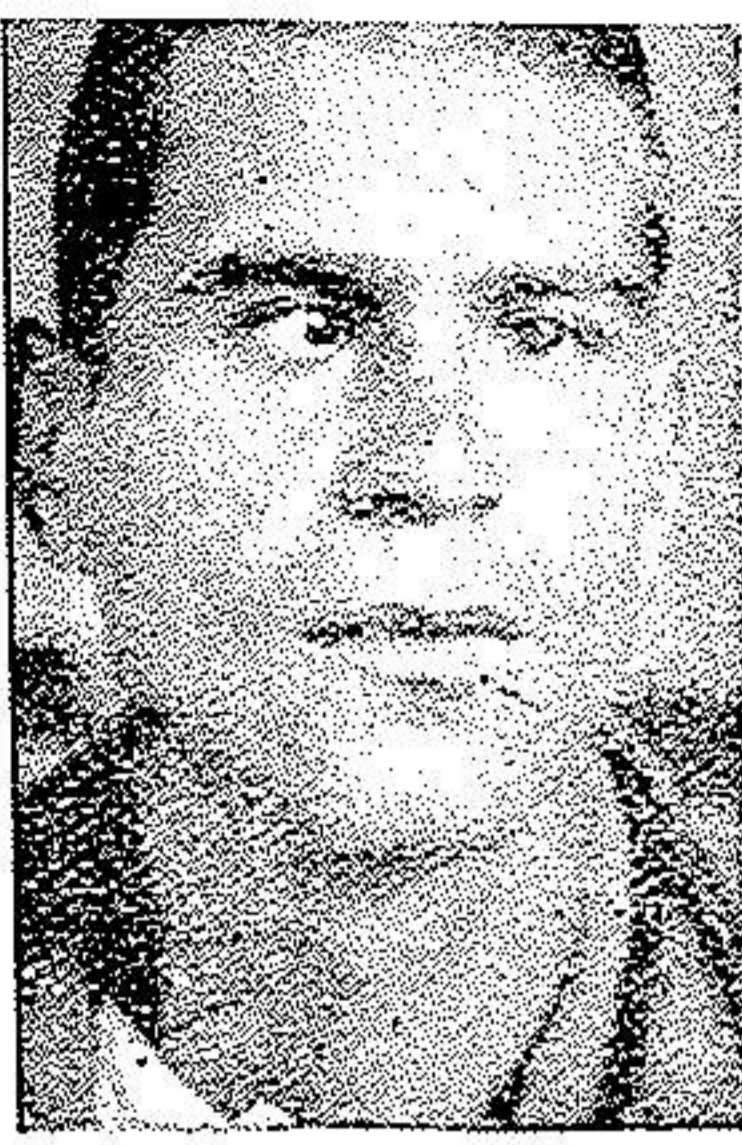
قبل از عمل