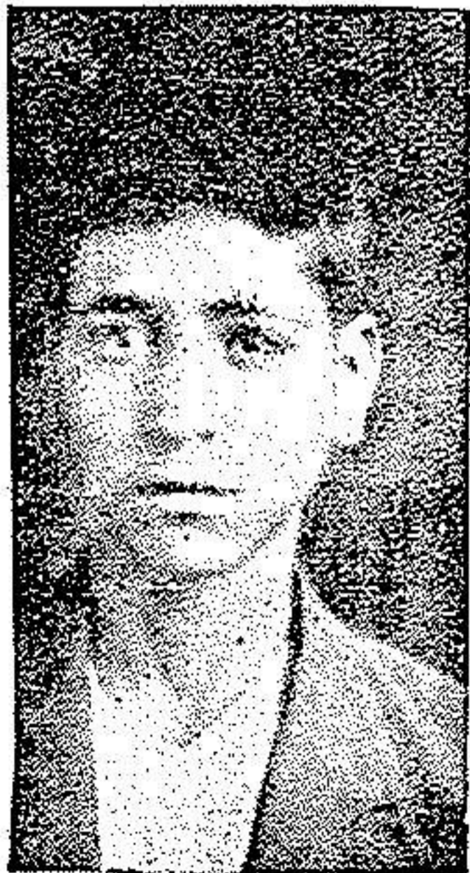
بعد از عمل