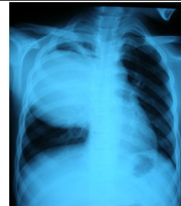
شکل-۲: نمای رادیولوژی و سی تی اسکن کیست در حال پاره شدن در جوان ۱۷ ساله (Crescent sign)

مبتلا در ۳۲٪، لوبکتومی ۷۴/۷٪، لوبکتومی و سگمنتکتومی ۱/۴٪ و پنومونکتومی ۰/۹٪ بود. ۲/۵٪ بیماران بیش از یک بار عمل شدند. زمان بستری اکثراً بین ۵-۱۵ روز بود (۷۵/۷٪). موربیدیتی ۸/۷٪ شامل عفونت زخم ۱۵ بیمار (۱/۵٪)، فضای باقیمانده در ۳۵ بیمار (۳/۴٪) شایع ترین عوارض بودند و مورتالیتی دو مورد به علت سن بالا و نارسایی تنفسی بعد از عمل بود (۱٪). حداقل فالوآپ دو سال و عود در ۲/۵٪ موارد دیده شد که ۹۵/۷٪ موارد عود درمان توأم جراحی و طبی و ۴/۳٪ درمان طبی شدند. در تمامی بیماران پس از جراحی با آلبندازول به مدت شش ماه درمان شدند.