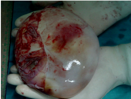
شکل-۳: نمای انوکلسیون (کیست سالم خارج شده) در درمان جراحی کیست هیپاتید