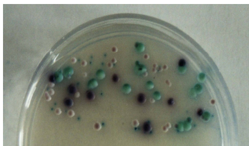
شکل ۲: جمعیت هتروژن کاندیدا در نمونه کشت دهانی در محیط کروم آگار کاندیدا

این مطالعه یک مطالعه توصیفی-تحلیلی بوده است و بیماران مورد بررسی در این مطالعه را ۱۵۰ بیمار مرد و زن آلوده به ویروس HIV مراجعه کننده به مرکز تحقیقات ایدز ایران واقع در بیمارستان امام خمینی تهران در بهار ۱۳۸۷ تشکیل می دهد. این بیماران افرادی بودند که برای دریافت درمان های مرتبط و معاینات دوره ای به این مرکز مراجعه و عفونت HIV با روش های الایزا و بلا تینگ به اثبات رسیده بود. قبل از نمونه برداری و انجام آزمایشات یک موافقت شفاهی از بیماران اخذ گردید و فرم جمع آوری اطلاعات استاندارد برای دریافت اطلاعات پر اهمیت بیماران از قبیل، سن، جنس، وضعیت درمان ضد ویروسی و ضد قارچی، شمارش سلول های \text{CD4}^+ ، استعمال دخانیات