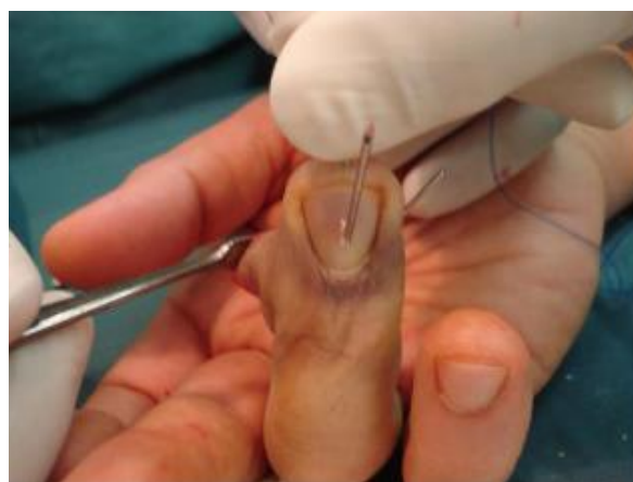
شکل-۳: محل خروج آنژیوکت از ناخن

معنای شکست نتیجه Pull out می‌باشد. معیار دوم نتیجه جراحی می‌باشد که منظور عملکرد بیمار می‌باشد. برای ارزیابی این نتیجه از مقیاس pulp to palm استفاده کردیم و بیماران را به صورت زیر تقسیم کردیم: در صورتی که بیمار حرکت طبیعی داشته باشد و کانتراکچر مفصلی نداشته باشد، نتیجه عالی می‌باشد. در صورتی که انگشت به کف دست می‌رسد اما فلکشن کانتراکچر زیر ۳۰ درجه دارد نتیجه خوب می‌باشد. در صورتی که انگشت حرکت دارد اما به کف دست نمی‌رسد نتیجه متوسط می‌باشد و در صورتی که انگشت از مفاصل DIP, PIP حرکت ندارد و فلکشن کانتراکچر بالای ۳۰ درجه دارد، نتیجه ضعیف می‌باشد ولی در مورد انگشت شست در صورت خم شدن مفصل اینترفالانژیال (IP) نتیجه خوب و در صورت فقدان هر