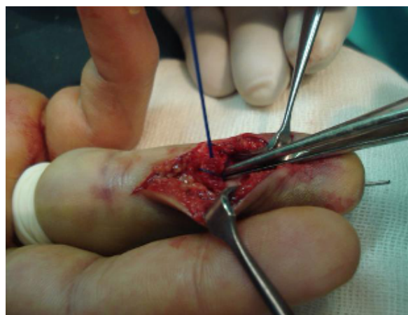
شکل-۱: نحوه گره زدن

پس از خروج آنژیوکت از ناخن نخ لوپ رد می‌شود و روی دکمه گره‌های متعدد زده می‌شود