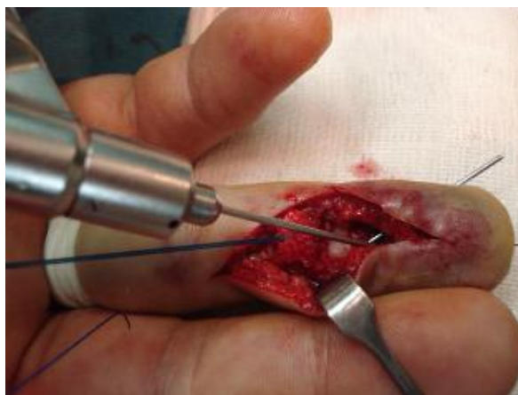
شکل-۲: سوراخ کردن استخوان جهت عبور دادن نخ لوپ

در هنگام دریل کردن استخوان از کناره ناخن محل خروج دریل چک می‌گردد.