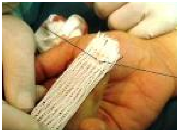
شکل-۵: نحوه گره زدن بر روی تکمه pull out

تاندون گره زده می‌شود به طوری که گره نخ دور تا دور تاندون قرار گیرد.