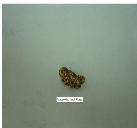
شکل - ۴: سنگ پانکراس که به دنبال عمل جراحی خارج شد.