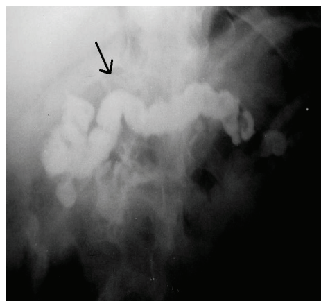
شکل - ۱: پانکراتوگرافی حین عمل: اتساع مجرای پانکراسی

که در تاریخ ۱۳۷۰/۶/۱۴ به درمانگاه جراحی بیمارستان قائم (عج) مراجعه نموده است، درد بیمار در ناحیه اپی گاستر با انتشار به دور کمر، از ابتدا شدید و مداوم بوده است بگونه ای که تزریق مواد مخدر نیز به مدت کوتاهی درد را تسکین می بخشید و حتی نظم بخش جراحی را به هم زده بود. در این مدت بیمار کاهش وزن به میزان ۱۵ کیلوگرم را نیز ذکر می نمود، در CT اسکن و سونوگرافی اتساع واضح مجرای پانکراس دیده نشده، آندوسکوپی انجام شده ولی انجام ERCP میسر نگردید. در آزمایشات انجام شده یافته ای غیر طبیعی دیده نشد و در محدوده نرمال بود. بیمار سابقه الکلیسم نداشت و در بررسی سنگ صفراوی نیز نداشت. همچنین لیپید و کلسیم سرم بررسی شد نرمال بود، هیچگونه سابقه درد شکمی قبل از شروع بیماری نداشته است. بالاجبار بیمار لاپاراتومی گردید. پانکراس کوچک و نسبتاً سفت و سفید رنگ بود و در قسمت میانی مجرای پانکراس متسع و برجسته بود. پانکراتیکوگرافی حین عمل با ماده حاجب اوروگرافین