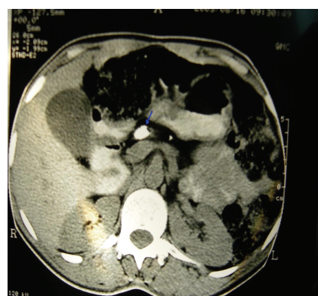
شکل - ۳: سی تی اسکن شکم: وجود سنگ و اتساع در مجرای پانکراس