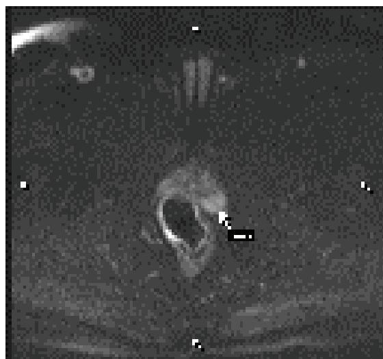
شکل ۱: توده در قسمت محیطی و چپ پروستات (Peripheral zone) در تصویر DWI نمای Restricted دارد.

میانگین سنی بیماران 67/4 \pm 9/6 سال با دامنه ۴۷ الی ۸۶ سال بود. یافته‌های این مطالعه نشان داد که در ۶۸ بیمار (۸۰٪) بر اساس نتایج بیوپسی سرطان پروستات منفی و در ۱۷ بیمار (۲۰٪) سرطان پروستات مثبت بود. هم‌چنین بر اساس نتایج DWI در تصاویر MRI در ۶۶ بیمار (۷۷/۶٪) سرطان پروستات منفی و در ۱۹ بیمار (۲۲/۴٪) سرطان پروستات مثبت بود (شکل ۱). نسبت وضعیت بدخیمی بر اساس DWI در تصاویر MRI بر حسب نتایج بیوپسی بررسی شد (جدول ۱) که حساسیت آن در تصاویر MRI برای تشخیص سرطان پروستات ۱۰۰٪، ویژگی 97/1 ٪، ارزش اخباری مثبت (PPV) 89/5 ٪ و ارزش اخباری منفی (NPV) آن 100 ٪ بود (جدول ۱). میزان توافق کاپای دو روش در تشخیص سرطان پروستات 93 ٪ بود ( P < 0/001 ).