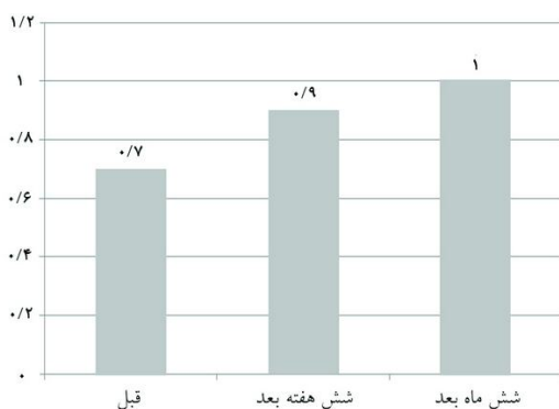
نمودار ۱: میزان جابه‌جایی ولار برحسب میلی‌متر در زمان‌های مختلف ( P = 0/049 )

میانگین سن افراد مورد بررسی 16/1 \pm 1/2 سال در محدوده سنی ۱۵-۱۹ سال بود. میزان جابه‌جایی ولار شش ماه پس از تزریق 1/0 \pm 0/3 میلی‌متر بود که در مقایسه با قبل از تزریق و شش هفته پس از تزریق کاهش معناداری را نشان داد ( P = 0/049 ) (نمودار ۱). شش هفته پس از تزریق افزایش جابه‌جایی ولار در ۱۰ نفر ( 66/7\% ) مشاهده شد. شش هفته پس از تزریق سایز Gap در دو نفر ( 13/3\% ) بدون تغییر، چهار نفر ( 26/7\% ) کاهش و در ۹ نفر ( 60\% )