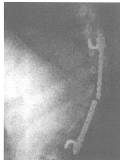
شکل ۴ - بیمار دچار کیفواسکولیوز کونژنیتال پس از سه سال

نتایج به تفکیک در گروهی که پیچ پدیکوله شکسته شده است: ۱- از بین رفتن اصلاح قوس جبرانی موجب شکسته شدن وسیله است (p value=0.05) ولی با از دست رفتن قوس ساختاری اولیه ارتباطی ندارد.