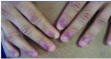
شکل ۳: دیستروفی ناخن‌ها