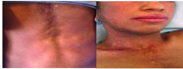
شکل ۱: پیگمانتاسیون شبکه‌ای در گردن، قسمت‌های فوقانی سینه و تنه

و اریترویید مشاهده شد. با توجه به شرح حال و معاینه بیمار و کاهش رده‌های سلول‌های خونی بیمار با تشخیص دیسکراتوز مادرزادی تحت بیوپسی پوست قرار گرفت که پاتولوژی با این تشخیص مطابقت داشت. با شروع آنتی‌بیوتیک به تدریج تب قطع و حال عمومی بیمار و حرکات مفصلی بهتر شد و جهت درمان پان‌سیتوپنی، بیمار به بخش انکولوژی منتقل گردید.