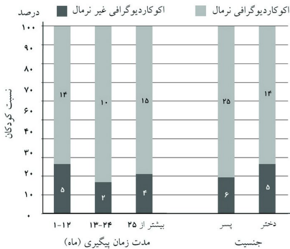
نمودار ۲: توزیع نتیجه اکوکاردیوگرافی بر حسب جنس و طول مدت پیگیری

*آزمون آماری: Student's t-test و P<۰/۰۵ سطح معناداری در نظر گرفته شده است.