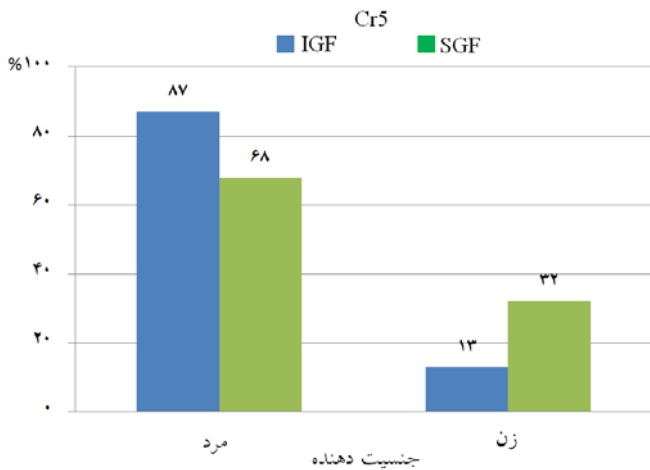
نمودار ۲: مقایسه فراوانی SGF در دو گروه با دهنده مذکر و مؤنث