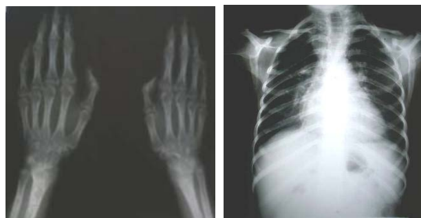
شکل ۳: عکسهای رادیولوژی بیمار

با توجه به یافته‌های بالینی خاص بیمار شامل کوتاهی قد، آترواسکلروز زودرس و ظاهر پیر (premature aging) در بانک اطلاعاتی Medline با استفاده از کلمات کلیدی فوق جستجو صورت گرفت. تشخیص‌های احتمالی شامل سندرم‌های HGPS و Werner و Metageria مطرح می‌باشند. قندهای ناشتای طبیعی، کوتاهی قد قابل توجه، استئولیز، بیماری قلبی در سنین پایین، عدم وجود کاتاراکت و عدم سابقه خانوادگی بیماری مشابه بر علیه تشخیص سندرم ورنر می‌باشد. کوتاهی قد، عدم وجود دیابت، عدم وجود ضایعات پوستی Poikiloderma و عدم وجود علائم ایسکمی اندام‌ها در این بیمار برخلاف تشخیص سندرم متاگریا می‌باشد. با توجه به تطابق یافته‌های بالینی با موارد مشابه تشخیص بیماری براساس شجره‌نامه و شرح حال بیمار و یافته‌های بالینی و آزمایشگاهی به نفع HGPS می‌باشد. ۳ شیوع سندرم پروگریا هوجینسون گیلفورد، یک در هشت