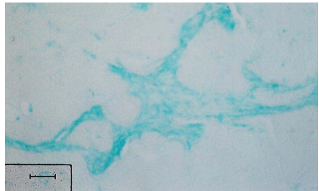
شکل-۳: واکنش استرومای تومور گرید III به رنگ‌آمیزی آلسین بلو. (pH=۵/۸)

جدول ۱- توزیع بیماران سرطان کولون بر اساس شدت واکنش به آلسین بلو برای نشان دادن اسید هیالورونیک