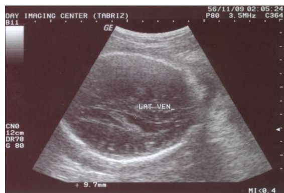
شکل ۳: یافته غیرطبیعی مورد گزارش، حداکثر اندازه بطن‌های طرفی مغز جنین در ناحیه آتریوم با ضخامت ۱۰ mm

در توده‌های بزرگتر از ۲ cm احتمال مرگ جنین بیشتر است. ۱۱ در گزارش حاضر، اندازه توده کوچکتر از ۲ cm بوده و علائمی از آریتمی و مایع پریکاردی و مایع جنبی و آسیت مشاهده نشد. در