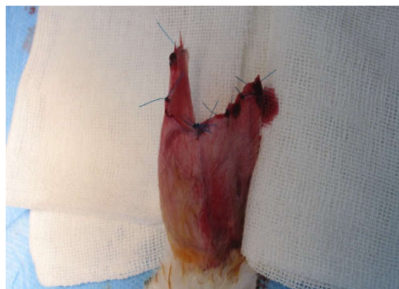
شکل ۳: برداشتن غضروف گوش

از غضروف جدا شده عکسبرداری انجام شد (شکل ۴). هر چند افزون بر وزن غضروف و باقی‌ماندن حجم و فرم آن در جراحی پلاستیک اهمیت زیادی دارد، در این مطالعه فقط وزن آن‌ها اندازه‌گیری شد و داده‌های در فرم مربوطه ثبت شد. نمونه‌ها در محلول فرمالین ۱۰٪ فیکس شد و جهت بررسی پاتولوژی فرستاده شد. در ادامه نمونه‌ها برش داده شده و رنگ‌آمیزی به روش هماتوکسلین و انوزین (H&E) انجام شد و نمونه‌ها از نظر میزان کندروسیت‌های زنده و فیروز توسط پاتولوژیست مورد بررسی قرار گرفت. نتایج حاصل از بررسی در هر یک از انواع گرفت‌ها در فرم‌های ویژه ثبت شد و سپس توسط SPSS software، version 19 (IBM SPSS, Armonk, NY, USA) تحلیل گردید.