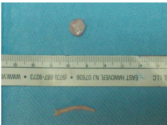
شکل ۴: غضروف‌های خارج شده دنده (پایین) و گوش (بالا)