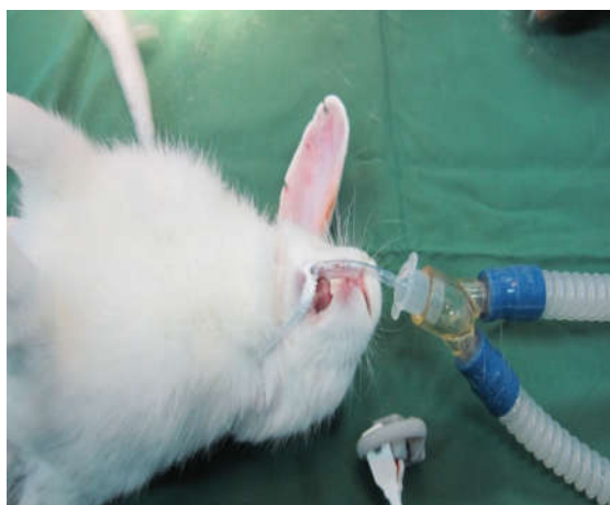
شکل ۱: لوله‌گذاری اندوتراکتال در خرگوش

آنتی‌بیوتیک پروفیلاکتیک انروفلوکساسین ۵ mg/kg عضلانی یک دوز تزریق گردید. تحت بیهوشی عمومی و پس از لیگاتور شریان و