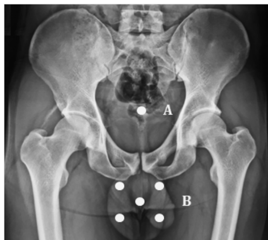
شکل ۲: نحوه چینی تراشه‌های TLD برای اندازه‌گیری مقادیر ESD لگن (A) و دوز دریافتی بیضه‌ها (B)

گردید (Feet toward the Cathode, FTC) و قسمت آند به سمت ناحیه مهره‌های کمری تنظیم و رادیوگرافی انجام شد. جهت حصول