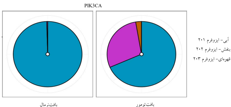
شکل ۱: ایزوفرم‌های بیان شده ژن PIK3CA در بافت تومور و نرمال مثانه

ایزوفرم‌های ژن PIK3CA در بافت تومور و نرمال در شکل ۱ نشان داده شده است. همانطور که مشاهده می‌شود در بافت نرمال فقط ترنسکریپت بزرگ‌تر و اصلی بیان می‌گردد، در صورتی که در بافت تومور سه ایزوفرم با نسبت‌های مختلف بیان شده‌اند که نشان دهنده تفاوت در بیان ایزوفرم‌ها در بافت سرطانی می‌باشد. ایزوفرم‌های ژن FGFR3 در شکل ۲ نمایش داده شده است. در بافت