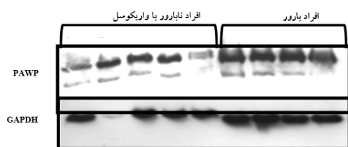
شکل ۳: وسترن بلات پروتیین‌های PAWP (باند ۲۸ کیلوالتون) و GAPDH (باند ۳۲ کیلوالتون) در چهار فرد بارور و پنج فرد نابارور با واریکوسل از طریق آنالیز آماری Independent t-test، گروه‌ها مقایسه شدند و ستاره نشانگر اختلاف معناداری بین دو گروه در سطح P < 0.05 است.

( 1/24 \pm 0/14 ) پایین‌تر بوده است ( P < 0/001 ). وسترن بلات PAWP اسپرم در چهار فرد بارور و پنج فرد نابارور در شکل ۳ نشان داده شده است. میانگین بیان نسبی PAWP در سطح پروتیین به‌طور معناداری در افراد نابارور با واریکوسل ( 0/67 \pm 0/8 ) در مقایسه با افراد بارور ( 1/00 \pm 0/13 ) به‌طور معناداری ( P = 0/03 ) پایین‌تر بود (شکل ۲).