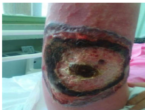
شکل ۲: پیشرفت ضایعه در طی بستری بیمار، افزایش تدریجی وسعت زخم با وجود دبریدمان سطحی ضایعه

دستگاه تناسلی، در اندام تحتانی در قسمت میانی سطح ران‌های بیمار هم ایجاد شده بود که به سرعت هم پیشرونده بود. تظاهرات بالینی ناحیه PG پس از عمل ممکن است مشابه نکروز فاشیا باشد که جهت افتراق آن با PG، حال عمومی به نسبت خوب بیمار، میزان تب پایین، کشت میکروب‌شناسی منفی زخم و همچنین پاسخ نامناسب به درمان آنتی‌بیوتیکی کمک‌کننده است، همچنین بیمار PG بدون علائم عمومی سپسیس است. از موارد دیگر تشخیص افتراقی ضایعه PG، هیدرادنیت چرکی و عفونت‌های تب خالی را می‌توان بیان کرد. ۸