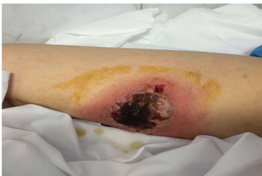
شکل ۱: ضایعه در بدو پذیرش بیمار، سطح میانی ران پای راست ناحیه ۱۰×۱۰ cm ناحیه، زخمی قرمز رنگ و ملتهب و دردناک با ضایعات پاپولی شکل.

با توجه به سابقه کولیت اولسروز در بیمار تشخیص تایید شد، از این‌رو پردنیزولون خوراکی به میزان ۶۰ mg در روز برای بیمار شروع شد که روند بهبود تدریجی ضایعه پس از شروع کورتون مشاهده شد و آنتی‌بیوتیک وریدی پس از ۱۰ روز قطع شد (شکل ۴). ترخیص بیمار با ادامه پردنیزولون خوراکی و اساکول و توصیه به قطع تدریجی کورتون انجام شد. همچنین ضایعه موضع عمل دستگاه تناسلی هم با این درمان بهبود پیدا کرد. در حال حاضر پس از شش ماه از پایان درمان بیمار در بهبودی کامل، بدون مصرف کورتیکواستروئید و تحت پیگیری است. این گزارش مورد با کسب اجازه و موافقت بیمار انجام شد.