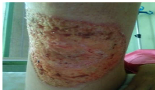
شکل ۳: ضایعه چند روز پس از شروع کورتون، بهبود تدریجی ضایعه پس از شروع کورتیکواستروئید

علائم کلینیکی و آزمایشگاهی بیماران PG غیراختصاصی است و تشخیص بر اساس رد سایر علل بیماری و نتیجه بیوپسی برداشته شده از ضایعه است. همیشه در این بیماران باید بیماری زمینه‌ای سیستمیک را بررسی کنیم. ۹ گزارش شده است که زن ۴۷ ساله با ضایعات دهانی و زخم ناحیه پرینه مشابه سندروم بهجت مراجعه کرده بود و بیوپسی ضایعه پوستی پرینه PG تشخیص داده شد و بیمار با درمان کورتیکواستروئید و آمینوسالسیلیک اسید بهبود یافت. همچنین در مطالعه روی ۱۳ بیمار مبتلا به PG با سابقه کولیت اولسروز، در شش بیمار به علت ترومای جراحی در محل، ضایعات پوستی ایجاد شد که با درمان کورتیکواستروئید سیستمیک بهبود پیدا کرد. ۱۰ در بررسی مقالات در مطالعه Cohort توسط Thomas و همکاران، ۷۵٪ مبتلایان به کرون مبتلا به PG شده بودند. ۹ از نظر