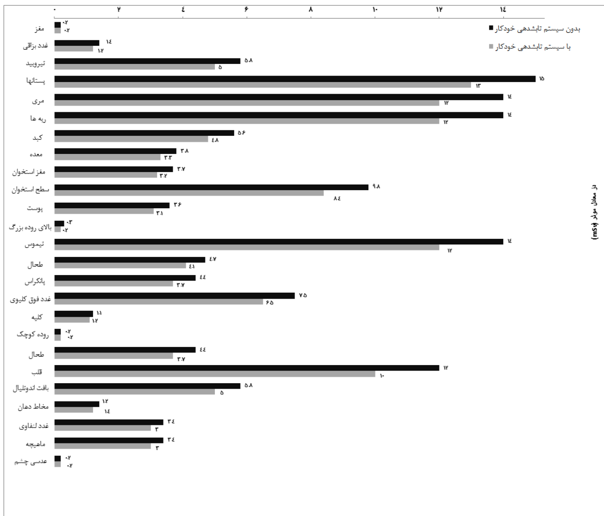
نمودار ۲: مقایسه دوز در اندام‌های مختلف در دو پروتکل با و بدون سیستم کنترل خودکار تابش‌دهی

گردنی گزارش شده است. ۲۰ Brisse و همکاران مطالعه‌ای تجربی با استفاده از فانتوم استاندارد بر روی آزمون‌های مختلف سی تی اسکن اطفال انجام دادند. در این مطالعه دوز ارگان‌های مختلف در دو حالت با و بدون سیستم کنترل خودکار تابش‌دهی برآورد و با هم مقایسه شد. ۱۱ نتایج این پژوهش نشان می‌دهد استفاده از سیستم کنترل خودکار تابش‌دهی باعث کاهش دوز در اندام‌های تیروئید (از ۶۱٪ به ۳۱٪)، ریه (از ۳۷٪ به ۲۱٪)،