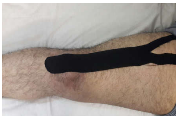
شکل ۱: نحوه چسباندن کینزیوتیپ بر روی عضله رکتوس فمورس