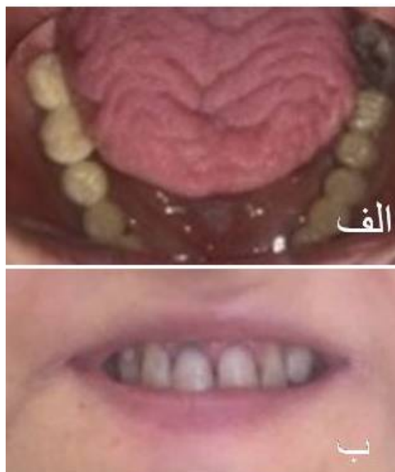
شکل ۱: الف- زبان شیاردار، ب- شقاق لب و دندان‌ها با ترمیم‌های کامپوزیت معیوب

اسکلروداکتیلی یا سفتی پوست اندام‌ها و تلائنکتازی نیز مشاهده نشد. نتیجه بررسی‌های آزمایشگاهی و پاراکلینیک به شرح زیر بود: هموگلوبولین: 11/8 \text{ g/dl} ، کورتیزول پایه سرم کاهش یافته (هشت صبح): 4/8 \text{ mg/dl} (مقدار طبیعی: ۳۰-۲۳۰)، هورمون آدرنوکورتیکوتروپین افزایش یافته: 32 \text{ pmol/l} (مقدار طبیعی: 1/6-13/9 )، فقدان افزایش