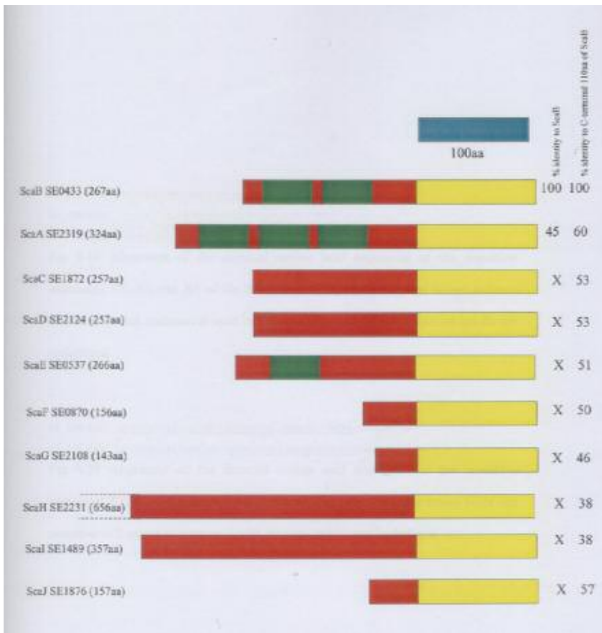
شکل ۱- تصویر شماتیک پروتئین‌های خانواده اسکا (Sca) در استافیلوکوکوس اپیدرمیدیس.

در این تصویر ۱۱۰ اسیدآمینو بخش C ترمینال پروتئین‌ها به همراه بخش‌های LysM نمایش داده شده است. برای مثال ScaB دارای ۲ بخش LysM می باشد. علامت X به معنای برابر بودن همولوژی پروتئین با بخش C ترمینال است.