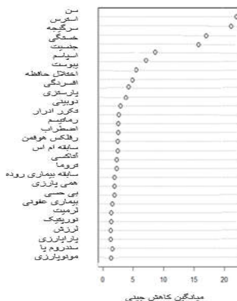
نمودار ۲: تعیین اهمیت متغیرها بر اساس میانگین کاهش جینی

در عرصه‌های پزشکی، همواره ابزاری برای پیش‌بینی وضعیت افراد در ابتلا به بیماری‌ها بر اساس عوامل خطر هر بیماری لازم است تا بتوان امکان پیشگیری به‌موقع و شناخت هرچه بهتر عوامل خطر را فراهم کرد. از سویی در بیشتر بیماری‌ها، شاهد تعداد زیادی از عوامل خطر هستیم که افزون‌بر داشتن اثرات متقابل با یکدیگر، دارای اثرات غیرخطی نیز هستند. ۳۳ به‌منظور شناسایی، تحلیل و بررسی این‌گونه اثرات و یافتن روابط غیرخطی میان آن‌ها، باید از ابزارهایی ویژه بهره برد. ابزاری که بتواند از انبوه داده‌های موجود الگوهای قابل‌توجه را