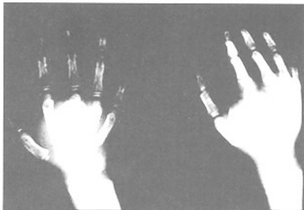
شکل ۱-الف- ضایعه لیتهیک در متاکارپ سوم

پسر ۱۲ ساله که به علت درد و تورم دست چپ به درمانگاه ارتوپدی مراجعه نموده است. مشکل بیمار از ۵ ماه قبل شروع شده، درد بیمار شبانه بوده و با تجویز آسپیرین بهبود نمی‌یابد. در معاینات تورم و تندرns در متاکارپ سوم وجود دارد (شکل ۱-الف). بیمار تحت عمل جراحی قرار گرفت و ضایعه به طور کامل برداشته شد و محل آن با سیمان ارتوپدی و وایر پر شد (شکل B-۳)، سه ماه پس از عمل اول سیمان خارج شد و گرافت استخوانی در محل گذاشته شد و اکنون ۵ سال پس از عمل دوم هنوز ضایعه عود نکرده است و بیمار مشکل خاصی ندارد.