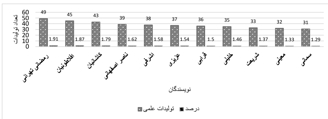
نمودار ۱: رتبه‌بندی نویسندگان پرتولید ایران از لحاظ چاپ مقاله در حوزه زنان و زایمان پیش و پس از طرح تحول نظام سلامت