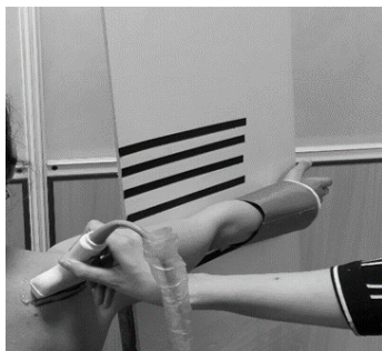
شکل ۳: ضخامت سونوگرافیک عضله در وضعیت آزمون full can