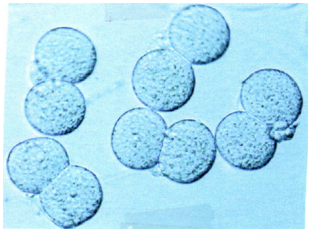
تصویر ۲- جنین‌های دو سلولی حاصل از کشت بلاستومرهای جدا شده از جنین دو سلولی در محیط کشت LIF+KSOM

در این مطالعه بلاستوسیست‌های اولیه (Early blastocyst) به آنهایی گفته می‌شد که بلاستوسل کمتر از نیمی از حجم جنین را بخود اختصاص می‌داد، بلاستوسیست (Blastocyst) به آنهایی گفته می‌شد که بلاستوسل بیش از نیمی از حجم جنین را اشغال نموده بود، بلاستوسیست کامل (Full blastocyst) به آنهایی گفته می‌شد که بلاستوسل بطور کامل جنین را اشغال نموده و نهایتاً بلاستوسیست در حال اتساع (Expanded blastocyst) به آنهایی گفته می‌شد که فقط با کشت نمونه‌های دارای پرده‌ی شفاف سالم می‌توان به