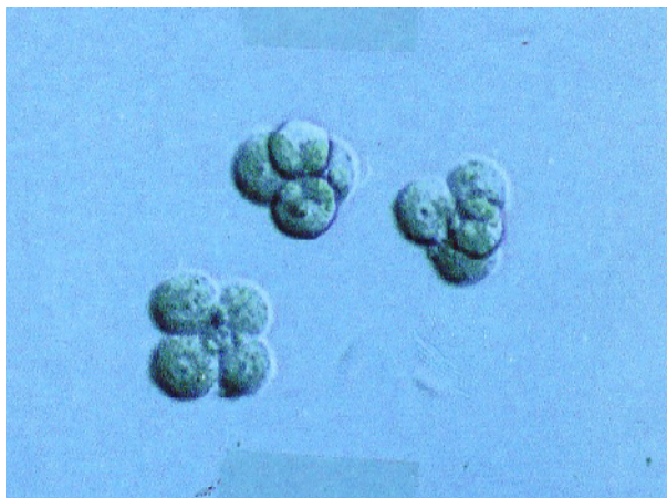
تصویر ۳- جنین های چهار و پنج سلولی حاصل از کشت بلاستومرهای جدا شده از جنین های چهار سلولی در محیط کشت LIF+KSOM

در بلاستوسیست های حاصل از کشت نمونه های دو سلولی، ۵/۵ \pm ۵۶ در بلاستوسیست های حاصل از کشت بلاستومرهای جدا شده از جنین های دو سلولی و ۴/۹ \pm ۵۰ در بلاستوسیست های حاصل از کشت بلاستومرهای جدا شده از جنین های چهار سلولی بود. با مقایسه میزان سلول های توده ای داخلی در بلاستوسیست های حاصل از کشت بلاستومرها با سلول های توده ای داخلی بلاستوسیست های حاصل از کشت جنین های سالم و دست نخورده مشاهده می شود که میزان این سلول ها در بلاستوسیست های حاصل از کشت بلاستومرها کمتر است ( P<0.05 ), حال آنکه میزان سلول های توده ای خارجی در هر چهار گروه مورد مطالعه با همدیگر تفاوت معنی داری را نشان نمی دهد ( P>0.05 ). لازم به ذکر است که از ۱۶۶ بلاستومر جدا شده از جنین دو سلولی ۱۲۲ بلاستومر ( ۳۷/۴۹ درصد) و از ۱۶۴ بلاستومر جدا شده از جنین های چهار سلولی ۱۱۹ بلاستومر ( ۷۲/۵۹ درصد) تقسیمات کلیواژی خود را طی ۲۴ ساعت اولیه کشت آغاز نمودند که میزان این تقسیمات با یکدیگر تفاوت معنی داری را نشان نمی دهد ( P>0.05 ).