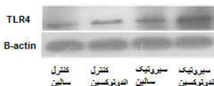
شکل ۲: تصویر وسترن بلات از بیان رسپتور TLR4 در کورتکس مغز در موش‌های صحرایی سالم یا مبتلا به سیروز تحت درمان نرمال سالیین و یا اندوتوکسین