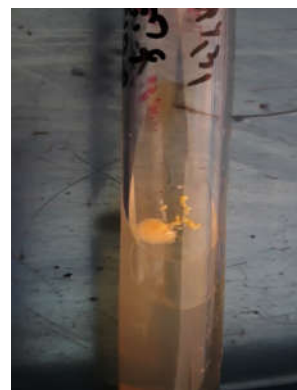
شکل ۳: کلنی مخمری سفید تا رنگ کرم ترایکوسپورون آساهی که بر روی محیط کشت سابورو دکستروز آگار دیده می‌شود.

به‌مدت چهار هفته) قرار گرفت و بهبودی حاصل شد. پس از دو هفته از اتمام درمان بیمار تحت آزمایش قرار گرفت که نتایج آزمایشات منفی بود.