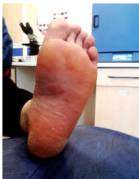
شکل ۱: تصویر بالینی از کف پای بیمار که با التهاب، قرمزی و پوسته‌ریزی دیده می‌شود.

به‌وسیله پرایمرهای یونیورسال (F5'-ITS1 (R5'-ITS4 و TCCGTAGGTGAACCTGCGG-3) (3-TCCCTCCGCTATTGATATGC-3) با روش واکنش زنجیره پلیمرز (Polymerase chain reaction-PCR) تکثیر گردید. واکنش زنجیره پلیمرز طبق الگوی زیر در دستگاه ترمال سایکلر (Thermal cycler, PeQLab, Germany) انجام شد: مرحله اولیه دناتوره (Denaturing) با یک سیکل در دمای 94^{\circ}\text{C} به مدت پنج دقیقه، مرحله دناتوره شدن (Denaturing) با 35^{\circ}\text{C} سیکل به مدت ۴۵ ثانیه در دمای 94^{\circ}\text{C} ، مرحله اتصال پرایمر (Annealing primer) در دمای 54^{\circ}\text{C} به مدت ۴۵ ثانیه و مرحله طولیل شدن (Extension) در دمای 72^{\circ}\text{C} به مدت ۹۰ ثانیه و مرحله نهایی طولیل شدن (Extension) به مدت ۱۰ دقیقه در دمای 72^{\circ}\text{C} . یک چاهک کنترل منفی نیز در حین انجام کار در نظر گرفته شد. محصول واکنش در ژل آگاروز (Agarose gel) ۱٪ الکتروفورز گردید و با رنگ‌آمیزی با اتیدیوم بروماید (Ethidium bromide) ( 0/5\ \mu\text{g/ml} ) یک محصول تک باندى به طول تقریبی ۵۵۰ جفت باز در روی ژل مشاهده شد و جهت سکونسیینگ (Sequencing) ارسال شد. نتایج سکونسیینگ در بررسی همولوژی آن در سیستم بانک ژنی (Gene Bank, NCBI, NIH, USA) تشابه یکسان بودن (Identity) ۱۰۰٪ را در ناحیه 28S rDNA گونه ترایکوسپورون آساهی ( T. asahii ) را نشان داد. جهت اقدام برای درمان بیمار در زمان آماده شدن نتیجه کشت، بیمار تحت درمان با فلوکنازول (Fluconazole) خوراکی (۱۵۰ میلی‌گرم در روز به مدت چهار هفته) و پماد کلوتریمازول (Clotrimazole) موضعی (دو بار در روز