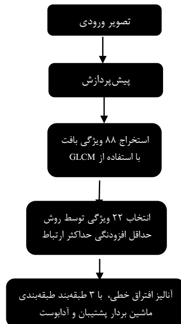
شکل ۳: بلوک دیاگرام کلی فرایند پیاده‌سازی شده جهت طبقه‌بندی مقدار چربی کبد از روی تصاویر التراسوند.

در شکل ۳ بلوک دیاگرام کلی فرایند پیاده‌سازی شده جهت طبقه‌بندی مقدار چربی کبد از روی تصاویر التراسوند نشان داده شده است. بعد از جمع‌آوری تصاویر التراسوند کبد، پیش‌پردازش شامل حذف اعداد و علامت انجام شده و سپس تصاویر برش داده شده و ناحیه حاشیه تصویر و برخی اطلاعات اضافی حذف شده است. بنابراین تصاویر با ابعاد ابتدایی ۶۳۶×۴۳۴ بعد از برش به ابعاد ۳۹۹×۳۹۹ درآورده می‌شوند. سپس از ماتریس هم‌رخداد سطح