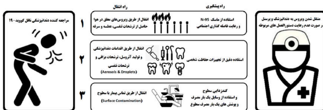
شکل ۱: راه‌های انتقال و راه‌های پیشگیری از انتقال کروناویروس به صورت کلی در محیط مراکز دندانپزشکی و حرف‌وابسته.

دراپلت (Droplet) و آئروسول) و غیرمستقیم (تماس با سطوح) می‌تواند به راحتی در محیط مراکز دندانپزشکی و حرف‌وابسته پراکنده شده و سبب ایجاد بیماری گردد. ۳۴ از این رو رعایت یک‌سری دستورالعمل‌های بهداشت شغلی و کنترل عفونت جهت کاهش پراکندگی ویروس در محیط‌های درمانی، به‌ویژه مطب‌ها و کلینیک‌های دندانپزشکی الزامی می‌باشد. در مبحث یافته‌های این مقاله سعی شده است با گردآوری مطالب متنوع از مقالات، دستورالعمل‌ها و گایدلاین‌های مرتبط با ارائه خدمات دندانپزشکی و حرف‌وابسته، که مورد توافق اکثر مراجع علمی مورد اعتماد دندانپزشکی هستند، مجموعه‌ای مبتنی بر شواهد در هشت بخش حاوی اطلاعات علمی و بالینی کاربردی در اختیار جامعه دندانپزشکی کشور و حرف‌وابسته، قرار داده شود.