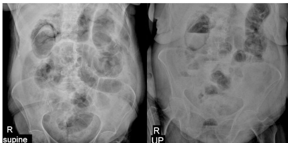
شکل ۲: گرافی خوابیده و ایستاده شکم با هوا در لومن و جدار کیسه صفرا و ریگلساین

اورژانس مراجعه کرده بود و با تشخیص کوله سیست آمفیزماتو تحت کوله سیستکتومی اورژانس قرار گرفته بود، معرفی می شود. کوله سیستیت آمفیزماتو با کوله سیستیت حاد ناشی از سنگ از نظر پاتولوژی و اپیدمیولوژی تفاوت دارد. ۶ کوله سیستیت حاد و مزمن معمولاً به دلیل انسداد گردن کیسه صفرا با سنگ صفراوی ایجاد می شوند، در حالی که کوله سیستیت آمفیزماتو به دلیل نکروز کیسه صفرا ناشی از انسداد یا ترومبوز شریان سیستیک رخ می دهد. ۷ اگر کوله سیستیت آمفیزماتو درمان نشود، بیماری پیشرفت کرده و سبب گانگرن احشاء می شود. میکروارگانیزمها به صورت هماتوزن در عضلات پنخس شده و منجر به شوک سپتیک می شوند. ۸ کوله سیستیت امفیزماتو معمولاً به دلیل افزایش بروز گانگرن و پرفوراسیون جدار کیسه صفرا مورتالیتی بالایی دارد که بین ۱۵ تا ۲۰٪ متغیر است، هرچند تشخیص و درمان زود هنگام در بهبود وضعیت بیمار موثر است. ۷ در مطالعه‌ای که توسط Sayit انجام شد در آزمایشات فرد مبتلا به کوله سیستیت آمفیزماتو، لکوسیتوز با افزایش درصد نوتروفیل و همچنین افزایش سطح بیلی روبین توتال و مستقیم گزارش شد. در مطالعه‌ای دیگر نیز لکوسیتوز به همراه افزایش درصد نوتروفیل، افزایش امینوترانسفرازها و بیلی روبین گزارش شد. ۹،۳ در مطالعه حاضر نیز لکوسیتوز با افزایش درصد نوتروفیل و همچنین