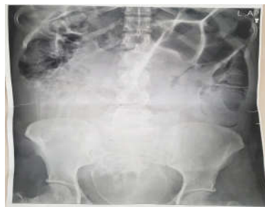
شکل ۱: درگرافی خوابیده و ایستاده شکمی معده و لوپ‌های روده کاملاً متسع و پر گاز است.

(Anal vrge) تغییر رنگ مخاط ارغوانی رویت شد و ترشحات داخل لومن سیگموئید به صورت خونی رویت شد. نکروز ایسکمیک برای بیمار مطرح شد. با احتمال قوی ولولوس، بیمار منتقل اتاق عمل شد. تحت شرایط استریل اتاق عمل پس از پرب و درپ، تحت بیهوشی عمومی در پوزیشن سوپاین با انسزیون میدلاین شکم باز شد. در بدو ورود هوا خارج نشد. مختصری مایع در شکم وجود داشت که ساکشن شد. شکم تمیز بود، رحم باردار ۳۰ هفته مشاهده شد. در بررسی کولون سیگموئید و کولون عرضی به شدت متسع و دولیکوسیگموئید (Dolichosigmoid) واضح وجود داشت که Detorsion صورت پذیرفت (شکل ۲). سایر قسمت‌های کولون و روده باریک و رکتوم بررسی شد که یافته پاتولوژیکی رویت نگردید. یک عدد رکتال تیوب جهت دکمپرس کردن کولون تعبیه گردید. سپس لویی از سیگموئید از بین الباف عضلات رکتوس از جدار شکم خارج گردید. شکم در پلان آناتومیک بسته شد و در انتها کولستومی ماچور (Mature) شد. باتوجه به عدم آمادگی روده و امکان نشت از محل آناتوموز سیگموئیدکتومی انجام نشد و جراحی رزکشن سیگموئید بیمار موکول به پس از زایمان، برطرف شدن اثر فشاری رحم باردار، پایدار شدن شرایط بیمار و آمادگی روده‌ای وی گردید. پس از چهار روز بیمار باحال عمومی خوب مرخص شد.