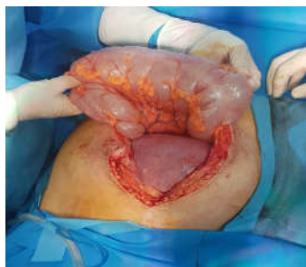
شکل ۲: کولون عرضی متسع پس از دتورشن به همراه رحم ۳۰ هفته مشهود است.