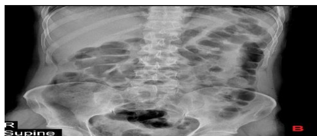
شکل ۱: گرافی P.A قفسه سینه (A) و گرافی خوابیده شکم (B) که گرافی شکم مشکوک به نوموپریتونن زیر کبد می‌باشد.